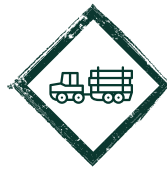
JOHN DEERE 1210 G